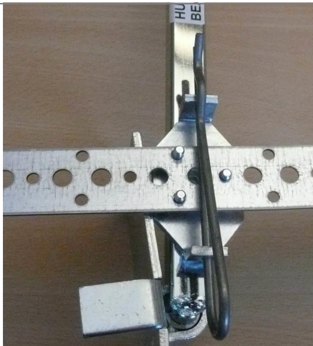
Mettre la goupille pour bloquer le feuillard